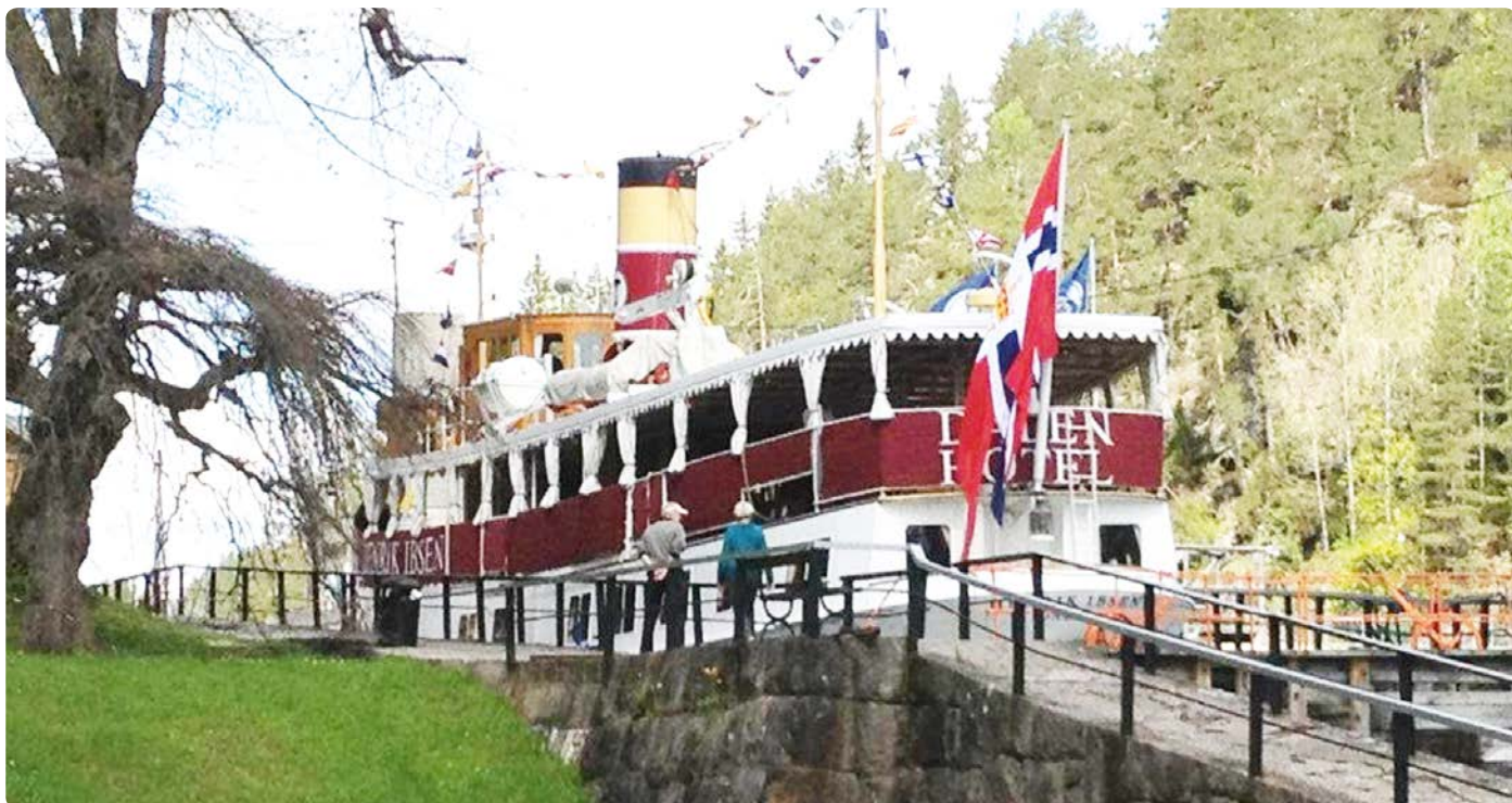
Henrik Ibsen på tur gjennom Telemarkskanalen.

Vi arrangerer også i år velferdstur til Telemarkskanalen. Dette er en tur for medlemmer og pårørende.